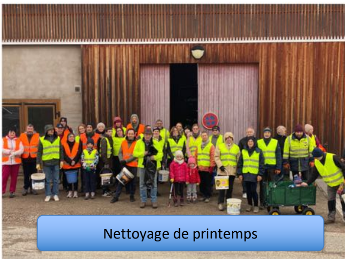
Nettoyage de printemps