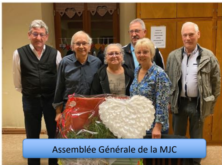
Assemblée Générale de la MJC