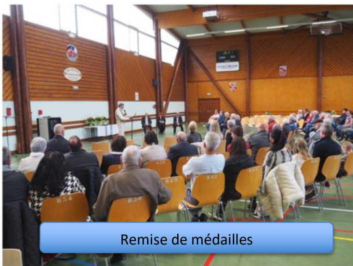
Remise de médailles