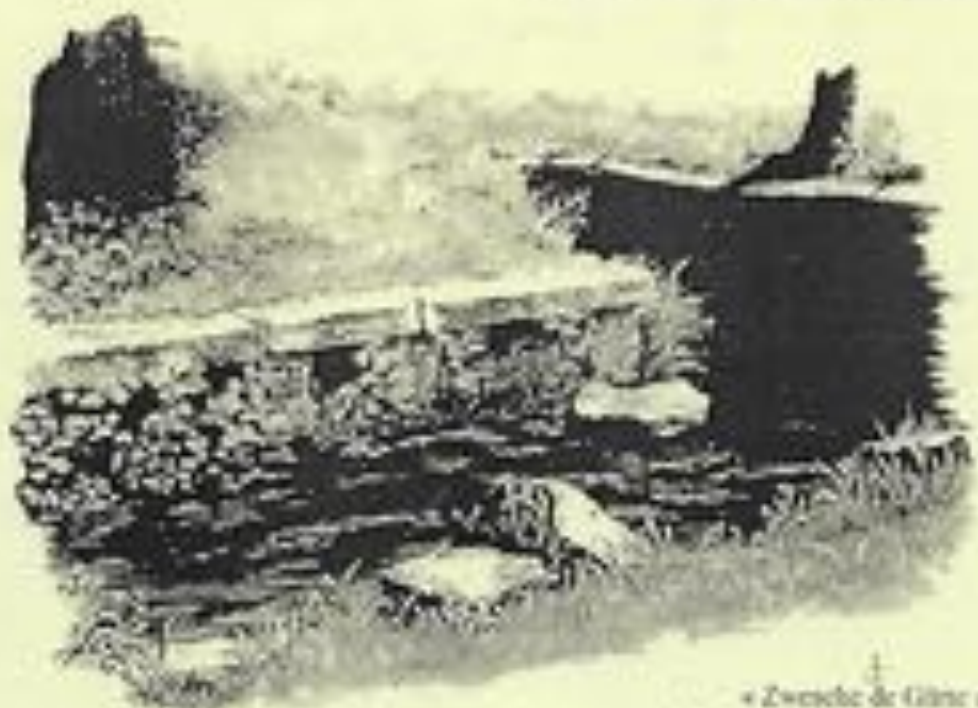
« Zwische de Girts » réalisé par Robert Bangratz

« Dorsbrunnen » (l'eau coulait en permanence).*