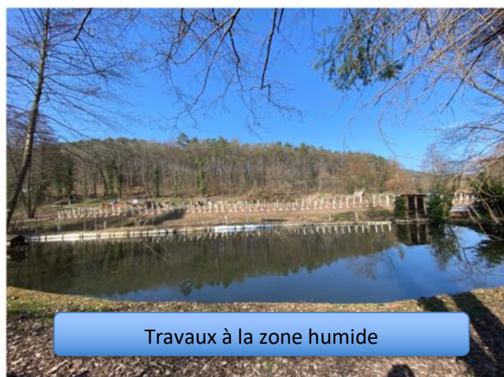
Travaux à la zone humide