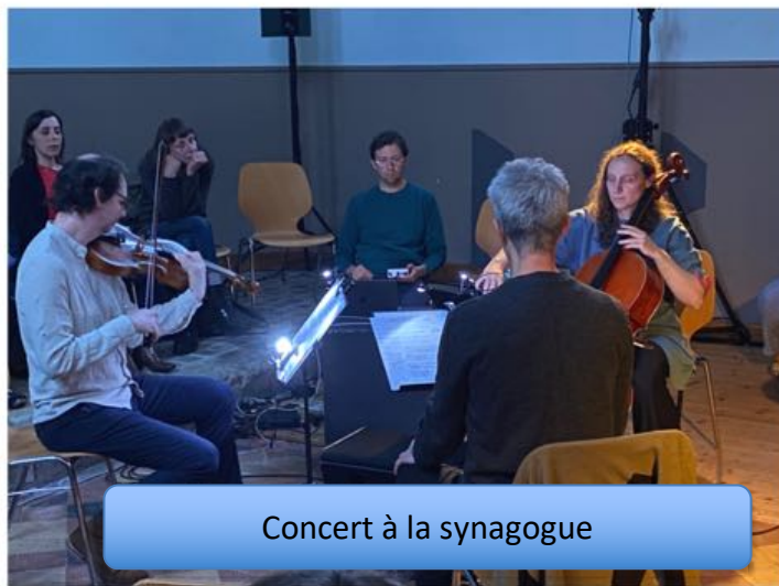
Concert à la synagogue