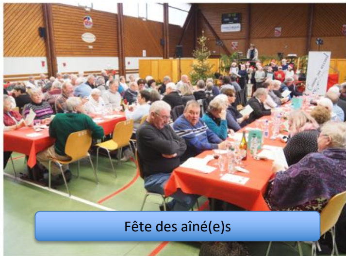
Fête des aîné(e)s