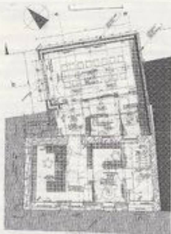
PROJET D'EXTENSION DE LA MAIRIE Architecte : Sophie Eichwald Mairie de Weiterswiler