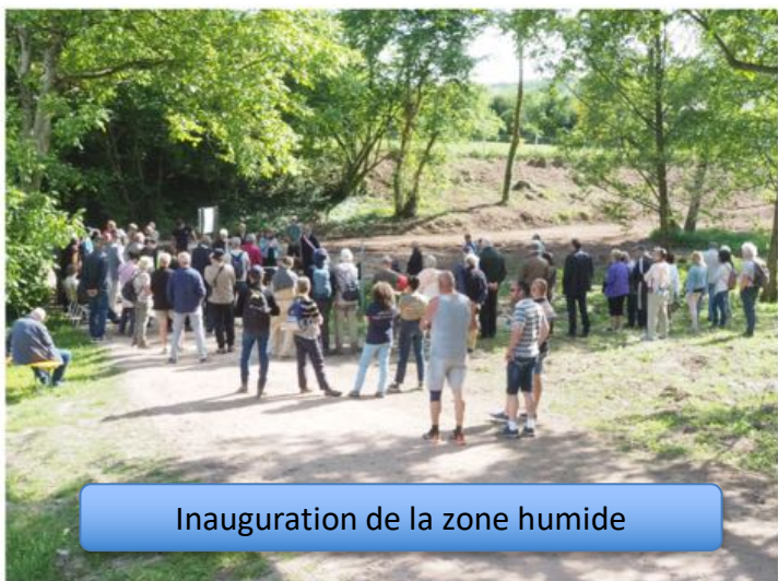
Inauguration de la zone humide