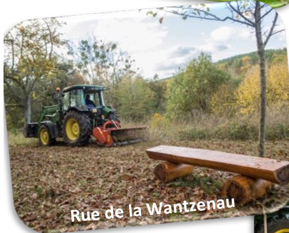
Rue de la Wantzenau