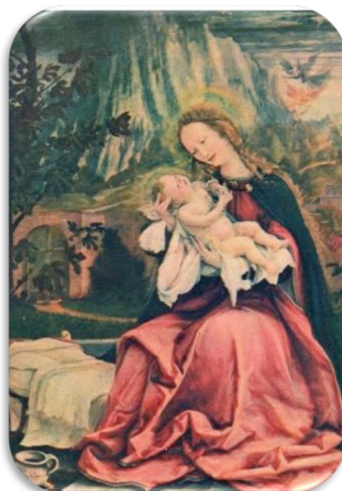
La Nativité de Mathias Grunewald Détail du retable d'Issenheim (1512-1516) Musée Unterlinden à Colmar