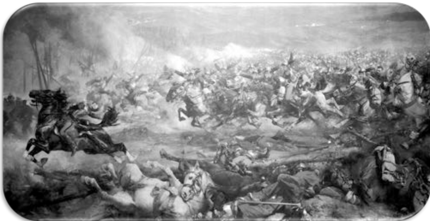
Bataille de FROESCHWILLER le 6 Août 1870 peint par Aimé Morot 1850 /1913