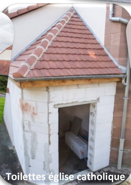
Toilettes église catholique