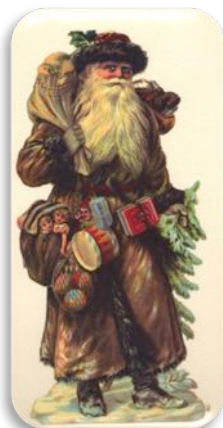
Hans Trapp de L'Imagerie Wentzel à Wissembourg