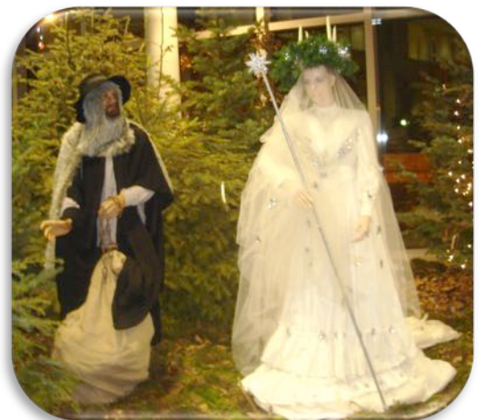
Hans Trapp & Christkindel Photo Andrée Buchmann Région Alsace 2012

4 – « Christkindel » est-elle un ange, une dame blanche ou une fée et comment traduit-on ce mot en français ?