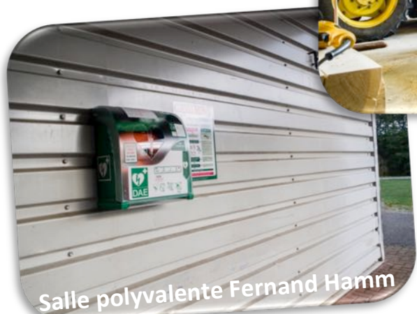
Salle polyvalente Fernand Hamm