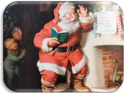
Santa Claus de Thomas Nast 1881 extrait de "Mysthologies" HS 4