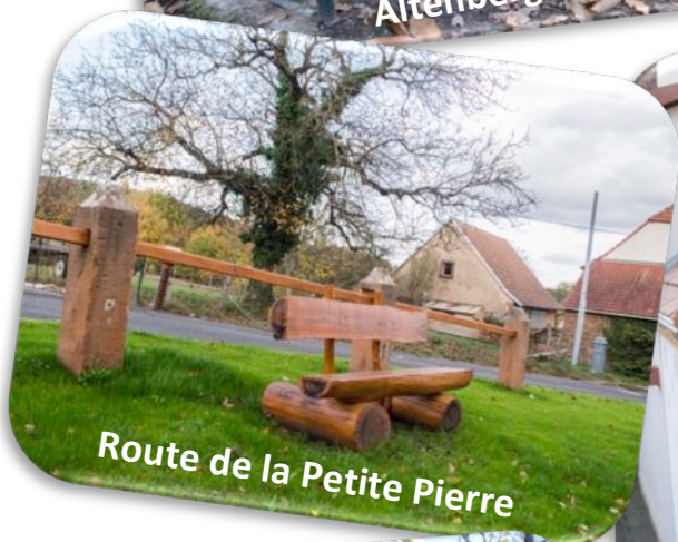
Route de la Petite Pierre